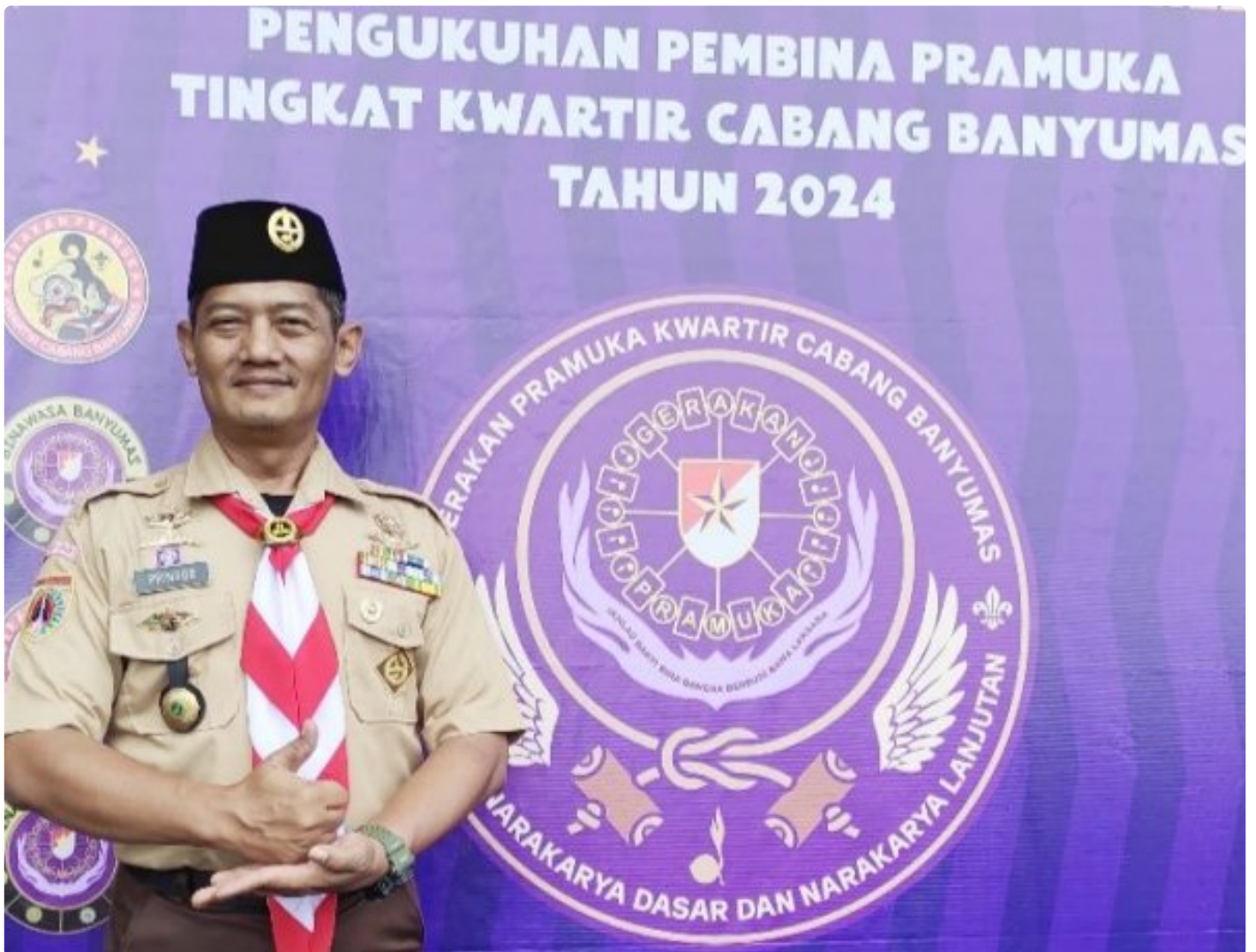
Kapenrem 071/Wijaya Kusuma dikukuhkan sebagai Pembina Pramuka Kwartcab Banyumas